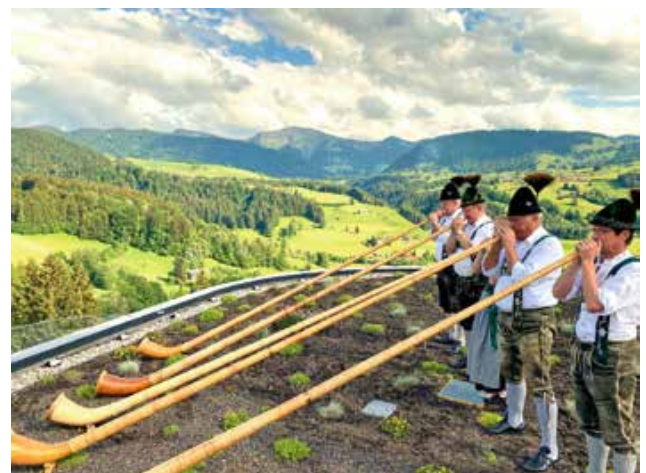
Alphornbläser in luftigen Höhen.