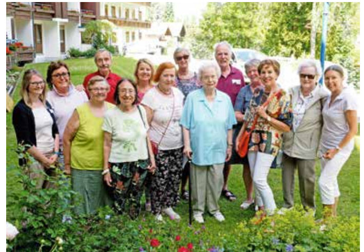
Die Mitglieder von „Besuch mich!“ vor der Corona-Pandemie.