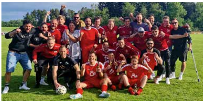
Die Staufner Fußballer bejubeln den Klassenerhalt in der Kreisklasse.

Weitere Informationen zum Kunstrasen-Projekt und zum Kauf der Kunstrasen-Parzellen gibt es unter: www.tsv-oberstaufen.de/kunstrasen