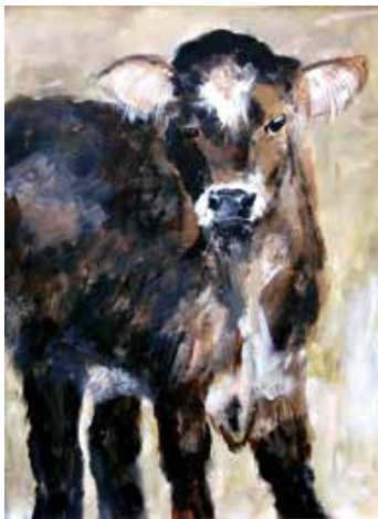
„Frechdachs“ von Hildegard Rasch

Der Künstlerkreis Oberstaufen mit seinen 14 aktiven Mitgliedern präsentiert seine 19. Kunstausstellung im Kurhaus Oberstaufen. Die Künstlerinnen und Künstler zeigen vom 11. bis 19. Juni 2022 je fünf selbstgewählte Gemälde in verschiedenen Techniken, Zeichnungen,