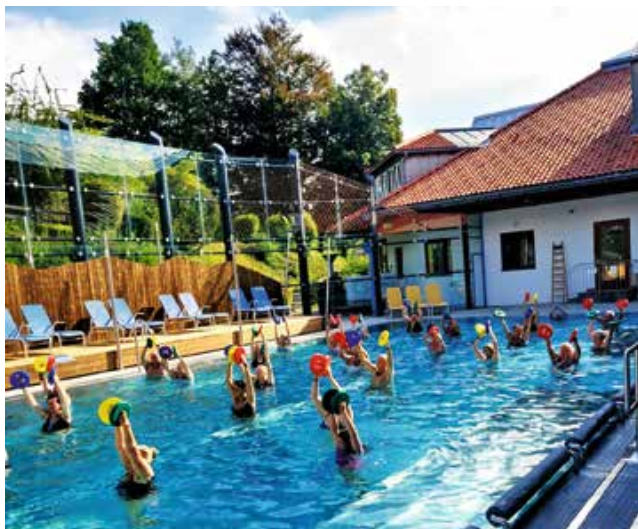
Wassergymnastik im neuen Außenbecken.