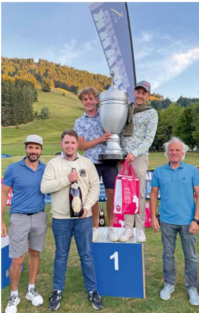
Das Brutto-Sieger-Team des ASV Golf Cup 2022

Zum 18. Mal fand am 13. August das Charity Golf Turnier des Allgäuer Skiverbandes statt. Und zum fünften Mal wurde der sportliche Wettstreit um den ASV Golf Cup im Golfclub Oberstaufen-Steibis ausgetragen. Freunde des Skisports treffen sich und spielen für einen guten Zweck. Im Vordergrund steht beim Charity Golf Cup des ASV die Förderung der Allgäuer Skijugend.