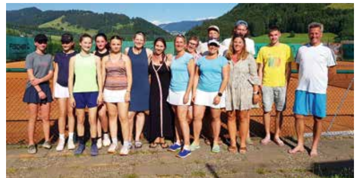
Mannschaften des TC Blau-Weiß Oberstaufen: Mädchen U15, Damen 40 und Herren

Erfolgreich waren am Samstag die Juniorinnen U18. Mit einem 4:2 Sieg beendeten sie die Saison gegen den FC Heimerdingen. Durch das verlegte Spiel der Mädchen U15, spielten am Sonntag gleich drei Mannschaften zuhause, die Herren, die Damen 40 und die Mädchen U15. Leider stand der Sonntag für die Oberstaufener Mannschaften unter keinem guten Stern. Die Damen 40 und die Mädchen U15 verloren mit 2:4 jeweils gegen den TC Sigmarszell. Auch die Herren beendeten ihre Saison mit einer 2:7-Niederlage gegen den TC Lindau II. Zum Glück ging es bei keiner der Mannschaften um den Klassenerhalt. Die Herren, die Damen 40 und die Juniorinnen U18 belegten am Ende der Saison die mittleren Plätze ihrer Tabelle. Unsere Kleinfeldmannschaft und die Mädchen U15 müssen ihre verregneten Spiele in den nächsten zwei Wochen nachspielen.