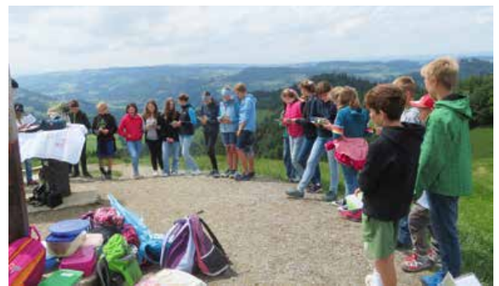
Berggottesdienst am Gipfelkreuz mit den Firmbewerbern