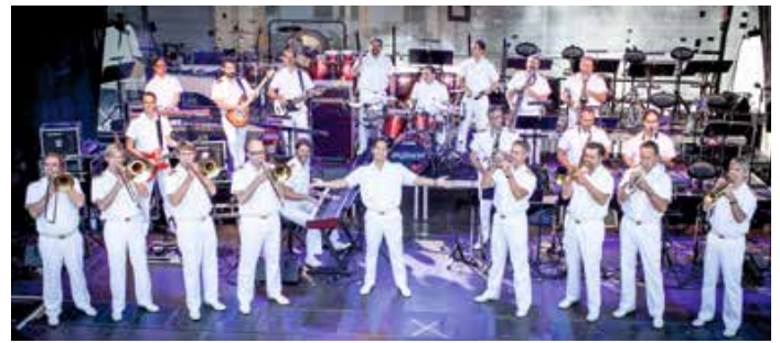
Die Big Band der Bundeswehr unter Leitung von Timor Oliver Chadik.

Raus aus dem Alltag, hinein in die Welt der Show- und Unterhaltungsmusik, des Swing, Rock und Pop, der Überraschungen und Emotionen, der Spezialeffekte und der Spielfreude: Lassen Sie sich mitreißen beim Open-Air-Konzert der Big Band der Bundeswehr am Dienstag, 16. August 2022 in Oberstaufen. Das Konzert findet bei jedem Wetter auf dem