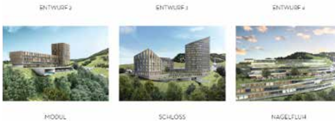
Entwürfe Schlossberg Resort

Zunächst setzte sich der Marktgemeinderat erneut mit dem Hotelprojekt auf dem Schlossberg auseinander. Nachdem in der Mai-Sitzung durch den Marktgemeinderat aus 5 Planungsansätzen 3 für eine weitere Vertiefung der Planung ausgewählt wurden, erfolgte in der Zwischenzeit eine Überarbeitung der verbliebenen Entwürfe „Modul“, „Schloss“ und „Nagelfluh“ auf Grund der vom Gestaltungsbeirat und dem Marktgemeinderat gegebenen Hinweise sowie eine detailliertere Prüfung hinsichtlich des Schallschutzes und des Brandschutzes. Der nun vorliegende Projektstand wurde dem Marktgemeinderat wieder von den Gestaltungsbeiräten, den Architekten Prof. Roland Gnaiger, Otto Kurz und Tim von Winning vorgestellt. Es gelte weiterhin, dass zwar nun bereits tiefer geprüfte, aber immer noch Entwurfsansätze, keine ausgeplanten Projekte zur Beurteilung stehen. Nicht ganz überraschend hat die nähere schallschutztechnische Untersuchung ergeben, dass der Entwurf „Nagelfluh“, welcher im Gegensatz zu allen anderen Entwürfen sehr in die Tiefe, hinunter Richtung B 308 verwirklicht würde, die schallschutztechnischen Vorgaben nicht erfüllen können. Dass diese Problematik bestehen könnte, hatten der Gestaltungsbeirat und einige Marktgemeinderäte schon in der vorherigen Sitzung bekundet und auch einige