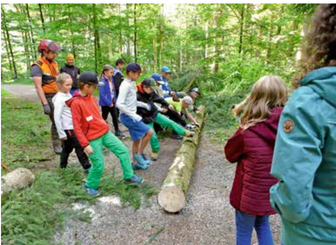
Am Schluss packt die ganze Klasse mit an und rollt den Baum vom Weg.

Mit lautem Krachen fällt eine große Fichte zu Boden und die NaturparkschülerInnen der