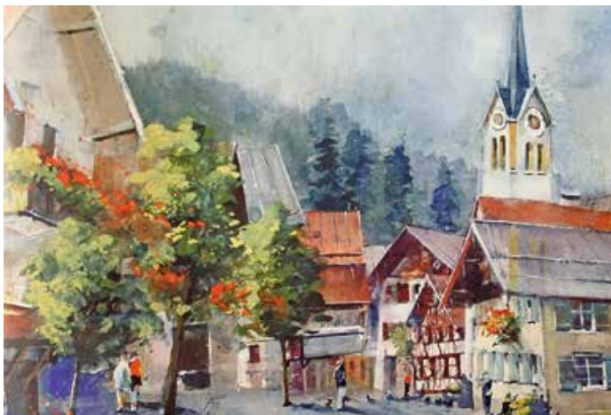
Aquarell von Heinz Hofer.

10.00 Uhr Bauernhausmuseum s'Huimatle in Knechtenhofen geöffnet bis 12.00 Uhr. Größere Gruppen und Führungen nach Vereinbarung unter 08325/602