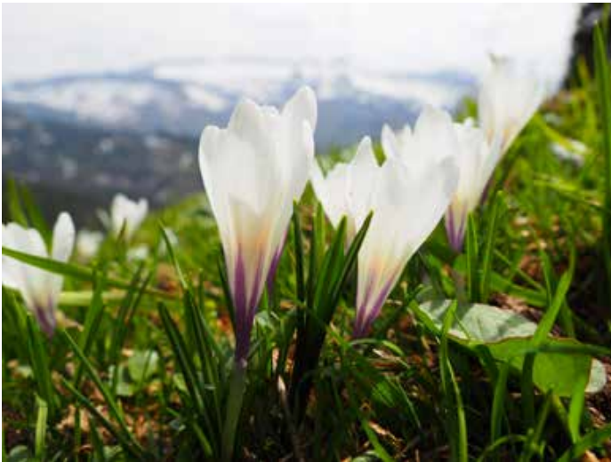
Der Frühlings-Krokus färbt die Alpflächen in ein Meer aus weißen und violetten Blüten. Bitte fotografiert das Naturschauspiel von den Wegen aus.

Sobald der Schnee geschmolzen ist, überzieht der Frühlingskrokus die Bergwiesen im Naturpark Nagelfluhkette mit einem Meer aus weißen und violetten Blütentrichterchen. Auf einigen Flächen blühen dann Abertausende der geschützten Schwertliliengewächse – ein kleines Wunder der Natur. Berühmt ist zum Beispiel die Krokusblüte am Hündle bei Thalkirchdorf, die jedes Jahr zahlreiche Besucher anlockt. Der Frühlingskrokus wird bis zu 15 Zentimeter hoch und hat dunkelgrüne, grasartige Blätter, die einen weißen Mittelnerv aufweisen und sich erst nach der Blüte voll entwickeln. Die aufrechtstehenden, weißen oder violetten Blüten setzen sich aus sechs Blütenblättern zusammen. Sie sind sehr temperaturempfindlich und reagieren bereits auf einen Unterschied von weniger als ein Grad Celsius – eine Wolke am Himmel kann schon ausreichen und die Blüten schließen sich! In den Alpen kommen die Frühlingskrokusse bis in 2600 Meter