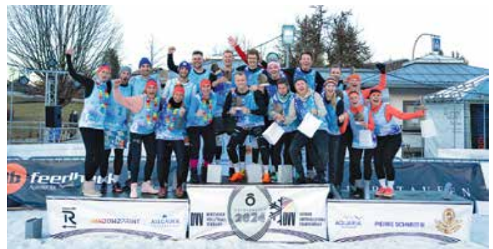
So sehen Sieger aus! Am Ende feierten die Teams gemeinsam die gelungenen Meisterschaften.