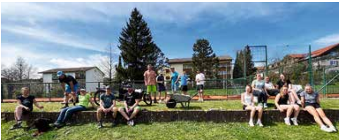
Eine Pause muss auch sein! Danke an alle Helfer.

Heimsaison eröffnen die Damen am 5. Mai, um 10 Uhr gegen den TSV Burgberg. 4 Mannschaften sind dieses Jahr in Oberstaufen am Start: Herren 30 in der Südliga 2, unsere Jüngsten, die Dunlop Midcourt U10 Südliga 2, Damen 40 in der Südliga 4 und ganz neu, die Damenmannschaft der Spielgemeinschaft des TC Blau-Weiß Oberstaufen und des ESC Immenstadt. Allen Tennisfreunden einen schönen Tennissommer und viele schöne, gesellige Stunden auf unserer schönen Tennisanlage.