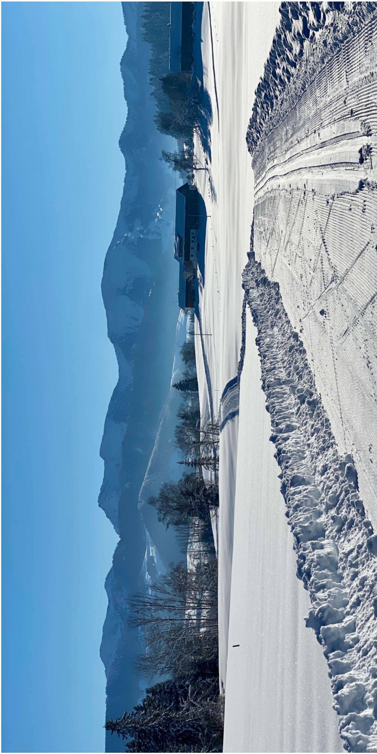
Langlaufloipe Stiefenhofen mit Blick zum Hochgrat