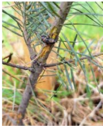
Rüsselkäfer frisst an einer jungen Douglasie in Grünenbach.

Durch die wärmer werdenden Tage steht der erste Schwärmflug der Fichten-Borkenkäfer unmittelbar bevor. Die Kontrolle von Fichten-Altbeständen auf frischen Käferbefall steht in den kommenden Wochen an. Dafür sind Sie als Waldbesitzer/-in selbst verantwortlich. Achten Sie auf frisches, braunes Bohrmehl in Rindenschuppen oder am Stammfuß. Haben Sie frisch be-