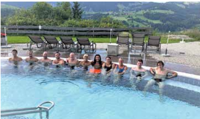
Unser ausgeschlafenes Team der Rettungsschwimmer.