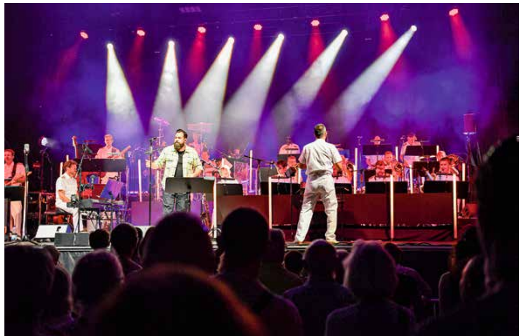
Gemeinsam mit dem Stargast Laith Al-Deen sorgte die Big Band der Bundeswehr auch in diesem Jahr wieder für einen unvergesslichen Abend an der Talstation der Hündlebahn.

Beim zweiten Teil des Showabends kam Stargast Laith Al-Deen mit auf die Bühne. Spätestens jetzt konnte niemand im Publikum mehr stillstehen. Es waren tausende Hände in der Luft zu sehen, die klatschten, sich im Takt mitbewegten oder die Momente mit ihren Handys festhielten, als Al-Deen seine bekanntesten Songs anstimmte. Seine tiefgehenden Songtexte und seine warme Stimme harmonierten mit der Energie und dem Facettenreichtum des unverkennbaren Big-Band-Sounds. Dazu eine hochmoderne, multimedial aufbereitete Show, die ihresgleichen sucht. Wie üblich bei den Konzerten der Big Band der Bundeswehr spielte diese ohne Gage, dafür für einen guten Zweck. Die Ortsgruppe des BRK stellte in diesem Jahr Helferinnen und Helfer, die beim Auf- und Abbau der Bühne unterstützen. Im Gegenzug kamen für die ehrenamtlichen Lebensretter vor Ort über 12.000 Euro Spenden zusammen, welche unter ande-