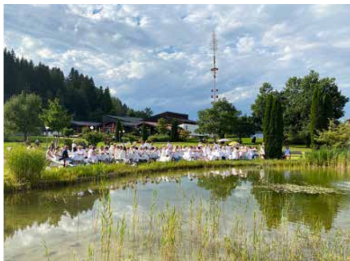
Impression vom diesjährigen Picknick in Weiß im Oberstaufen PARK.

Kreationen auf Grundlage der „Hiesigen“ Xaver und Fini. Das Sommergewitter nach 20.00 Uhr ließ den Abend leider etwas abrupt enden. Da in diesem Jahr abermals mehr Besucher zum Picknick kamen und alle Plätze bereits um 18.00 Uhr belegt waren, werden wir als Oberstaufen Tourismus im nächsten Jahr nochmals aufstocken: mehr Sitzplätze mit Tischen, mehr Hussen, mehr Blumen und Dekoration sowie immer wieder neue Überraschungen im Rahmenprogramm.