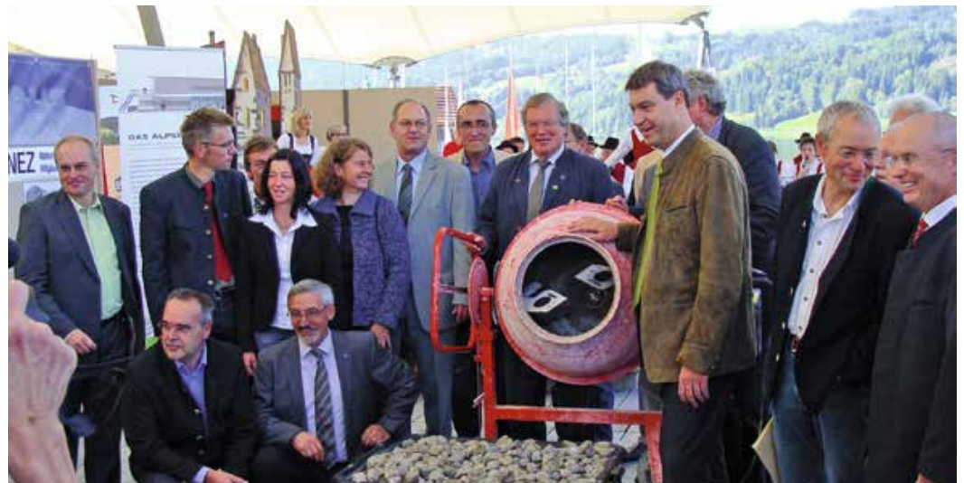
2011 war Markus Söder, damals Umweltminister, bei der Grundsteinlegung für das heutige Naturparkzentrum dabei.