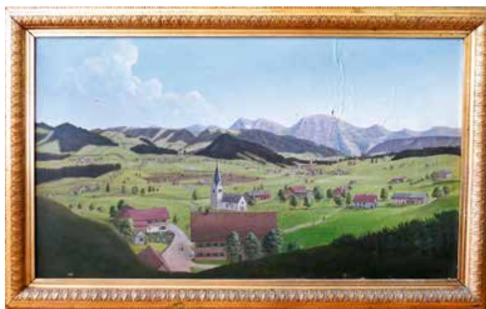
Folge 11: Genhofen im Jahr 1886

Von Genhofen gibt es eine wunderschöne Ortsansicht, die im Sommer 1886 entstanden ist. Gemalt wurde sie von Wilhelm Woher aus Isny, der bis 1885 Besitzer einer Textilfabrik und Weberei in Schüttentobel bei Ebratshofen war.