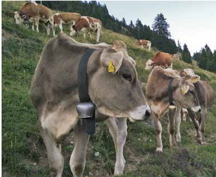
Wie in den Jahren zuvor werden

Im Festzelt sorgt währenddessen der „Förderverein Staufner Viehscheid e.V.“ mit seinen fleißigen Mitgliedern für das leibliche Wohl.