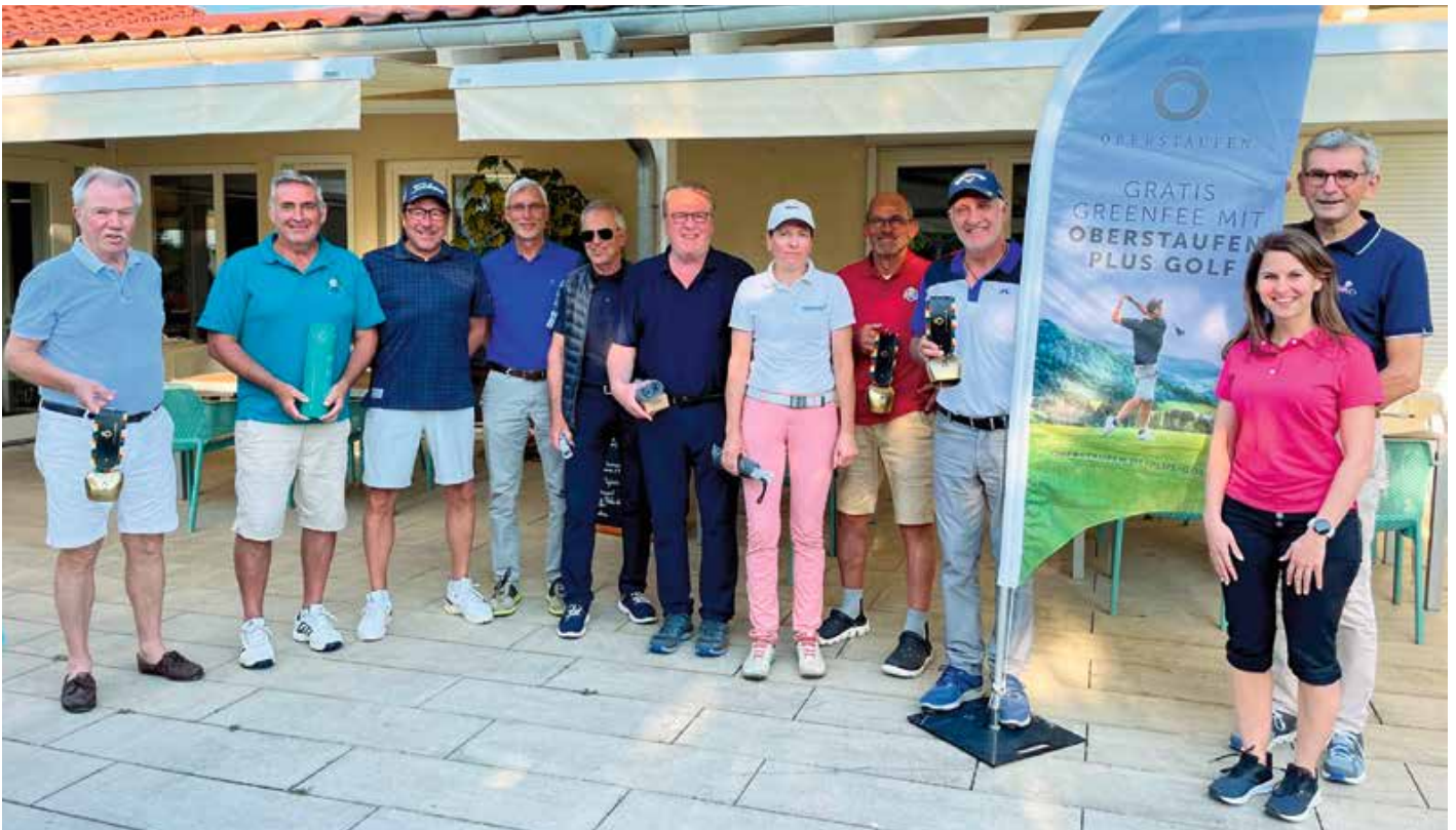
Stellvertretend für begeisterte Sieger: Die Gewinner des „After Work-Cup Oberstaufen“ am 26. Mai im Golfclub Urloffen bei der Siegerehrung.